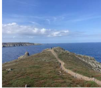
Vers la Pointe du Raz

2. Formez la bonne phrase en reliant deux parties de phrases puis traduisez!