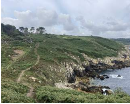
Les roches blanches