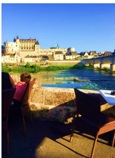
le Château d'Amboise