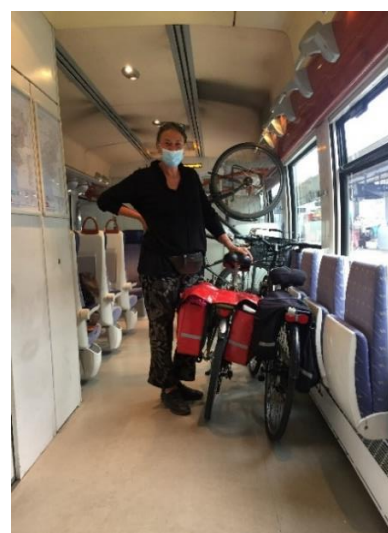
et le retour en train 😊