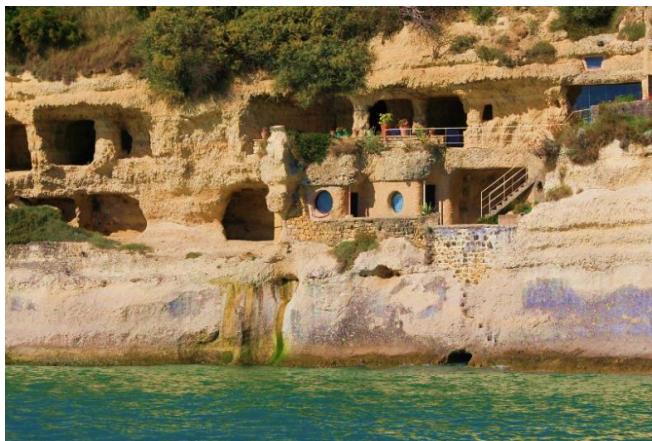
un troglodyte près de Saumur