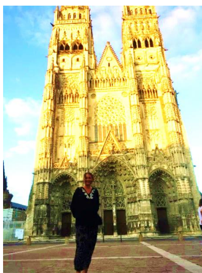
La Cathédrale de Tours

Et comme dans tous les voyages, il y a des moments imprévus et magiques. D'abord le jeu de lumières dans la Chapelle Saint Hubert (la photo en haut). Puis, une autre fois, après avoir passé une nuit près du château de Chambord, je me suis réveillée très tôt le matin pour continuer ma route et j'ai traversé une magnifique forêt. J'ai aperçu une biche puis un sanglier (a doe and a boar). Quel bonheur de se lever de bonne heure!(tôt le matin) Et peu avant d'arriver à NANTES, il y avait des buvettes (refreshment stand) tout le long de la route et les gens buvaient et riaient en buvant du vin. Il faisait très chaud mais moi je buvais de l'eau parce que c'est préférable quand on est sur la route! En faisant des haltes rafraîchissantes, j'ai rencontré des gens sympa!